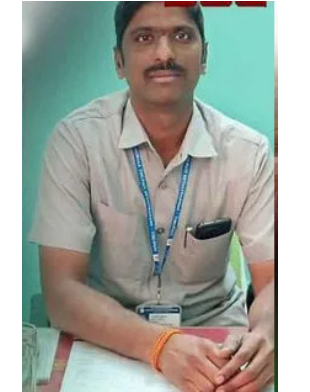
నవేదికను ఇటీవల ఏపీ హైకోర్టుకు డి.జి.డి. సమర్పించింది. ఈ నవేదికను పరిగణించింది. అత్యధిక సమర్పించి ఏపీ హైకోర్టు స్పష్టం చేసింది. పరకామణిలో వెంటనే చేపట్టాల్సిన సంస్కరణలపై ఏపీ హైకోర్టుకు డి.జి.డి. సోమవారం అందే. జనవరి 05 వ తేదీన నవేదిక అందజేసింది. ఈ నవేదికను పరిగణించి ఏపీ హైకోర్టు గురువారంపై విధంగా స్పందించింది.

అమరావతి, జనవరి 08: పరకామణి కేసులో సుప్రీంకోర్టు ఆదేశాలను పరిగణనలోకి తీసుకుంది. చట్టప్రకారం మండలకేంద్రాలను ఏపీసీ డి.జి. సీఎడికి ఏపీ హైకోర్టు ఆదేశించింది. అలాగే అప్పజైవ అధికారులపై శాశాసనసభ వర్తించు తీసుకోవాలని డి.జి.డి. పోలీసు, సంబంధిత శాఖల ఉన్నాధికారులకు హైకోర్టు స్పష్టం చేసింది. డి.జి.డి. పరకామణి కేసు విచారణ సందర్భంగా గురువారం నాడు ఏపీ హైకోర్టు ఈ ఆదేశాలు జారీ చేసింది.