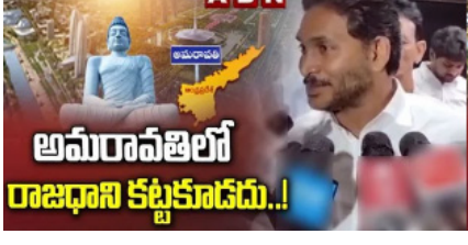
అమరావతిపై రాజధాని కట్టకూడదు..!

ఏపీకి మూడు రాజధానులు ఉండాలంటూ వైఎస్ జగన్ ఏపీ అసెంబ్లీలో కీలక ప్రకటన చేశారు. ఆ క్రమంలో అసెంబ్లీలో అమరావతి, న్యాయ రాజధాని, పరిపాలన రాజధాని విశాఖపట్టణం అంటూ వివరణ ఇచ్చారు. దీంతో రాజధాని అమరావతికి భూములు ఇచ్చిన రైతులు అందోళనకు దిగారు. తమ విన్నపాలు విచారించాలి వారు చేతుకున్న విజ్ఞప్తిని సీఎం వైఎస్ జగన్ పెడమీస పెట్టారు. రాంకో రైతులు నాటి సుందీ అందోళనలు, నిరసనలు, డీక్షలు